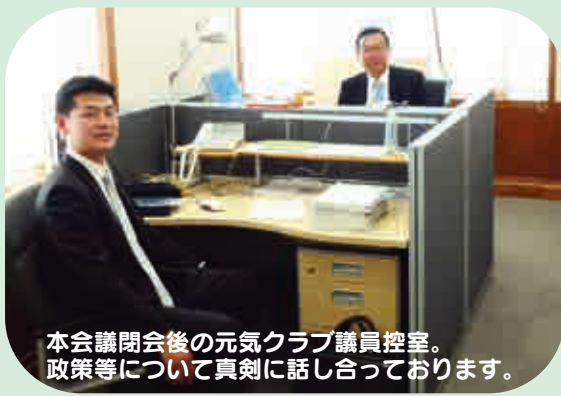
本会議閉会後の元気クラブ議員控室。政策等について真剣に話し合っております。