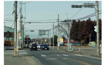
右折車両による交通渋滞対策