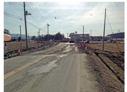
通学路歩道未整備の危険箇所対策

※他にも多くの要望箇所、完成済・着工済箇所がありますが、主たるものを掲載しました。