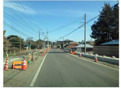
歩道及び水路整備